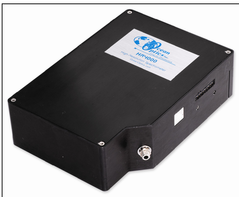
Внешний вид спектрометра HR4000

Спектрометры Ocean Optics соединяются с компьютером через порт USB. Модель HR4000 также позволяет использовать последовательный порт. При подключении по интерфейсу USB 2.0 или 1.1 спектрометр получает питание от компьютера и не требует внешнего источника питания.